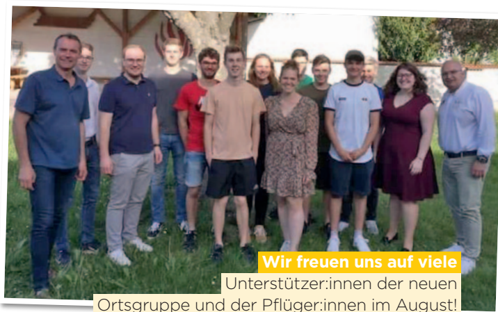
Wir freuen uns auf viele Unterstützer:innen der neuen Ortsgruppe und der Pflüger:innen im August!

Besonders freut uns, dass wir den Landesentscheid Pflügen heuer gemeinsam mit erfahrenen Meistern aus der Pflügerhochburg veranstalten dürfen. So wird auch der Trainingstag vor dem Bewerb am 13. August wieder eingeführt.