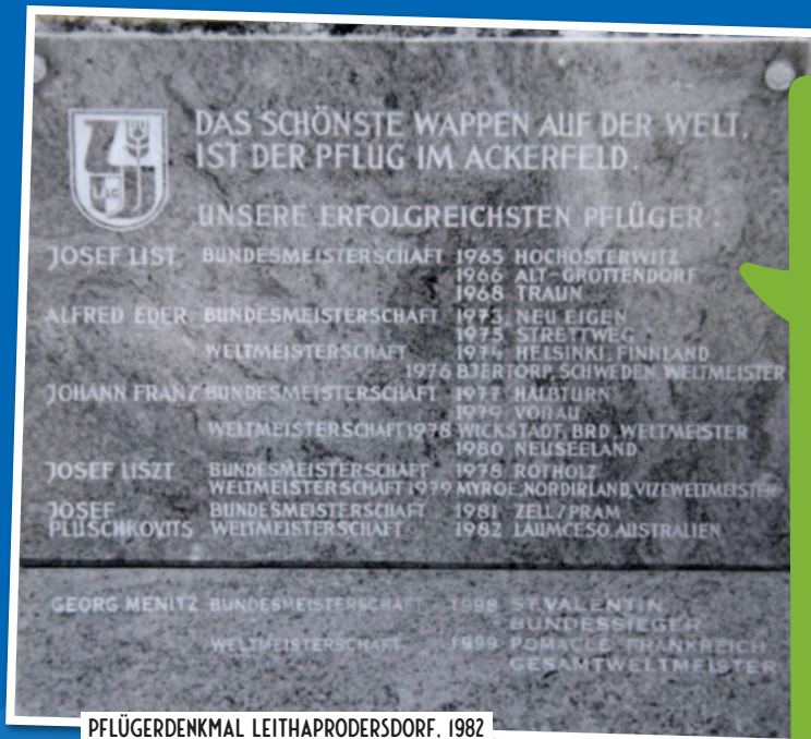
PFLÜGERDENKMAL LEITHAPRODERSDORF, 1982