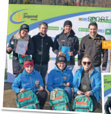
Die Mädchenwertung gewann die LJ Tiffen (FE).