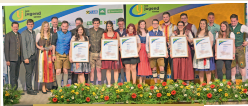
Die Plätze 4 bis 10 der aktivsten Ortsgruppen

Bei der 17. Nacht der Landjugend Kärnten wurde die aktivste Ortsgruppe des Arbeitsjahres 2021 gekürt. Den „Goldenen Löwen“ nahm die Landjugendgruppe Krappfeld (SV) mit nach Hause.