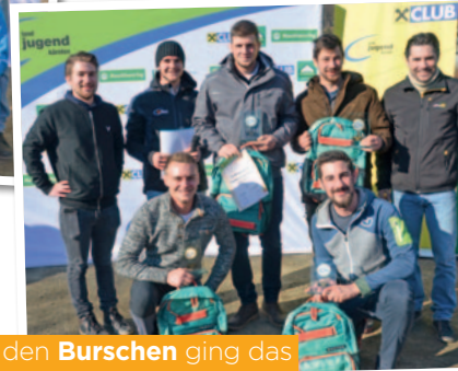
Bei den Burschen ging das Team der LJ Steuerberg (FE) als Sieger hervor.