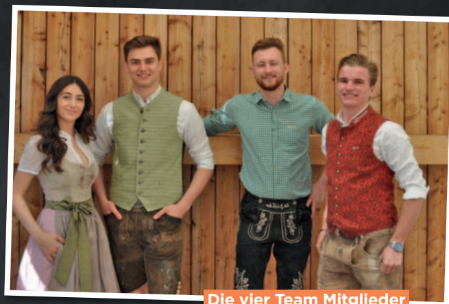
Die vier Team Mitglieder von „Festl“

In nächster Zeit steht unser Fokus auf dem Vertrieb von Tickets innerhalb der Festl App. So soll der Ticketkauf digitalisiert