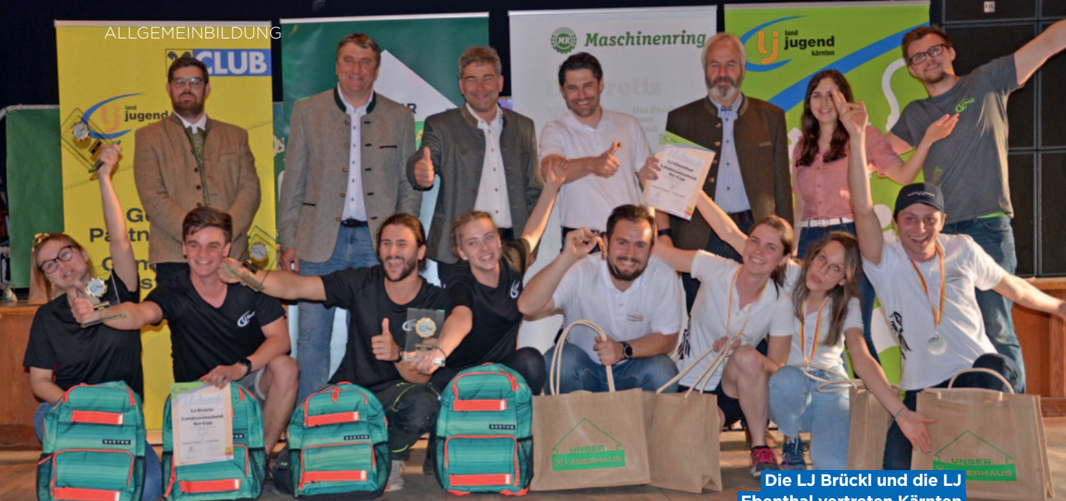
Die LJ Brückl und die LJ Ebenthal vertreten Kärnten beim Bundesentscheid.