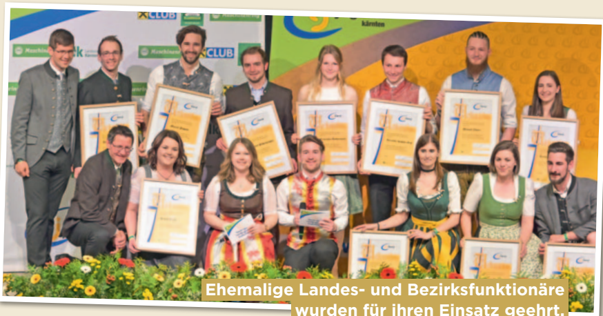
Ehemalige Landes- und Bezirksfunktionäre wurden für ihren Einsatz geehrt.